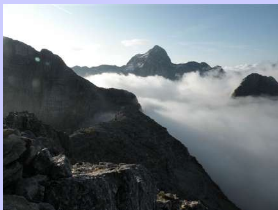
pogled na Triglav sa Križa