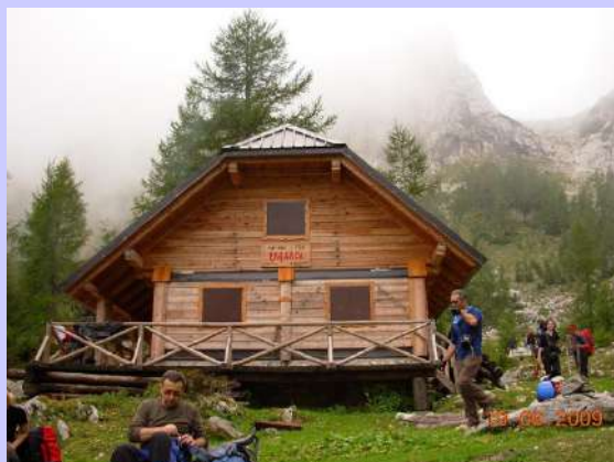
planinarska kuća u Krmi

Bezbedno smo se spustili do doma i nastavili prema dolini Krme gde nas je kod Kovinarske kočice čekao autobus. Iz doline Krme autobus nas je odveo do Aljaževog doma gde smo sačekali grupu koja se spuštala sa Škrlatice.