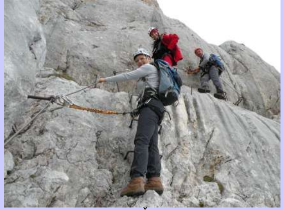
na vrhu Škrlatice

Silaženje je, po pravilu, bilo teže. Ponovo smo na raskrsnici. Rastajemo se od dva poljska planinara koji se vraćaju u Pogačnikov dom. Naš pravac je Bivak IV i Aljažev dom. Dosadno je silaženje ali tu se ništa ne može promeniti. U prvi mrak stižemo do autobusa. Nastavljamo dalje ka Sevnicama gde nas dočekaše i ovom prilikom ljubazni domaćini planinarskog društva Lisca.