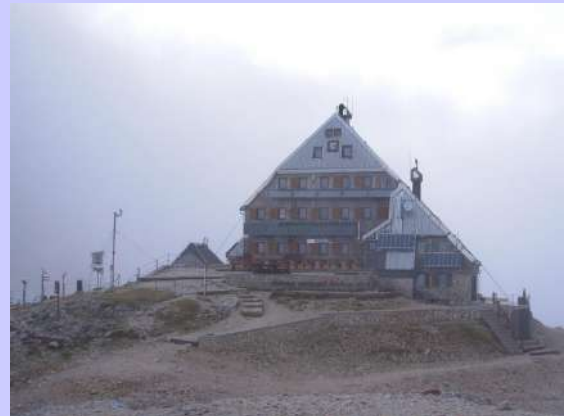
dom na Kredarici

Grupa od 23 planinara krenula je na uspon od Aljaževog doma (1015m), pa preko Praga ka najvišem vrhu Slovenije, Triglav (2864m). Već nakon 15-ak minuta uspona počinje kiša koja nas je pratila do doma na Kredarici (2515m). Posle uspona uz prve stene jedna planinarka odustaje od daljeg uspona uvidevši da ne može pratiti tempo grupe i da će istu usporiti. Ona se bezbedno vratila do Aljaževog doma a mi smo nastavili uspon. Uspon preko Praga je za mnoge iz grupe bio pravi izazov zbog nekoliko vertikala i same kiše koja je u mnogome otežavala uspon, jer su stene, klinovi i sajle bile izuzetno klizave. Na par mesta samom stazom slevali su se potoci vode nastali od jake kiše.